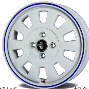
ホワイト&ブルー ライン