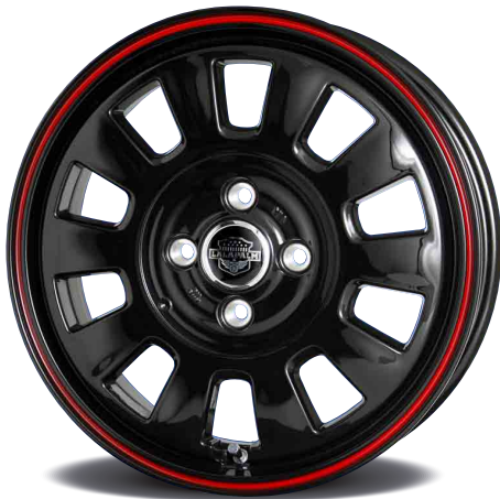
ブラック&レッドライン