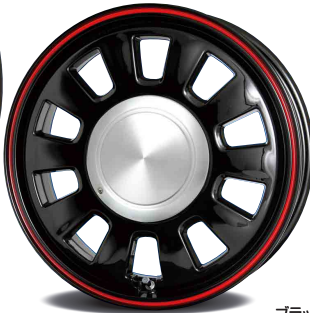
ブラック&レッド ラインムーンカバー