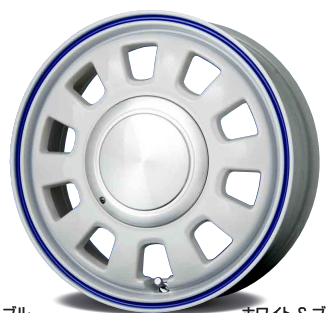
ホワイト&ブルー ラインムーンカバー