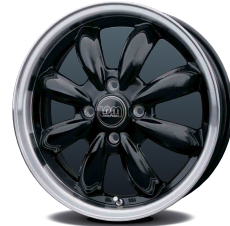
ピアノブラック&リムポリッシュ (BK&リムP)