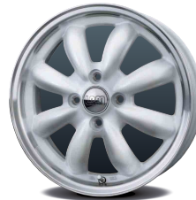
パールホワイト&リムポリッシュ (PW/リムP)

スポーティーにも街乗りにもピッタリな ボリュームのあるスポーク。クラシカルな 雰囲気の中に个性的で注目を浴びる スタイルを演出してくれる。