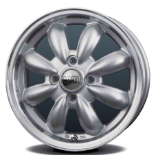
ブラチナシルバー&リムポリッシュ (S/リムP)