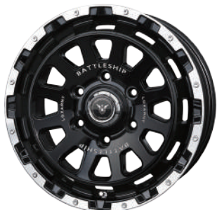
グロスブラックリップポリッシュ

独自の個性を放つディッシュ面をさらに強調する ディープリムの存在感 "ロクサーニバトルシップネオ"