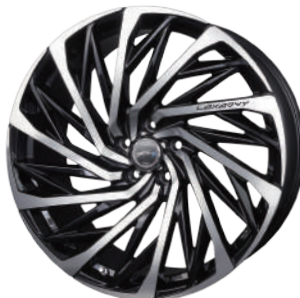
ブラックポリッシュ