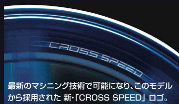
最新のマシニング技術で可能になり、このモデル から採用された新「CROSS SPEED」ロゴ。

軽量化と高剛性という相反するテーマを フローフォーミングテクノロジーを採用する ことで実現。走りの原点を追求し、 アグレッシブなフォルムと機能を共有した。